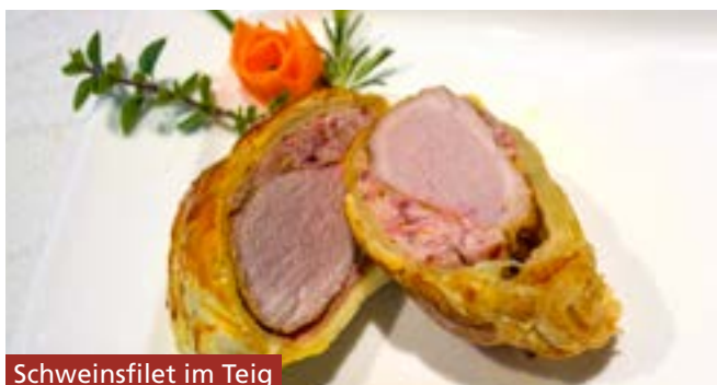
Schweinshaxe im Teig