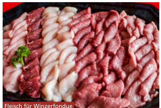
Fleisch für Winzerfondue