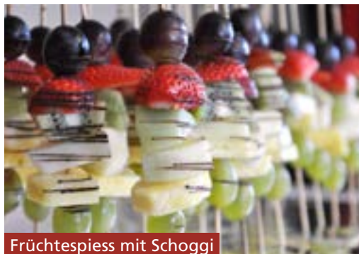
Früchtespiess mit Schoggi

Für Spezialwünsche bezüglich Torten/ Desserts können Sie direkt bei der Confiserie Alexanders anfragen.