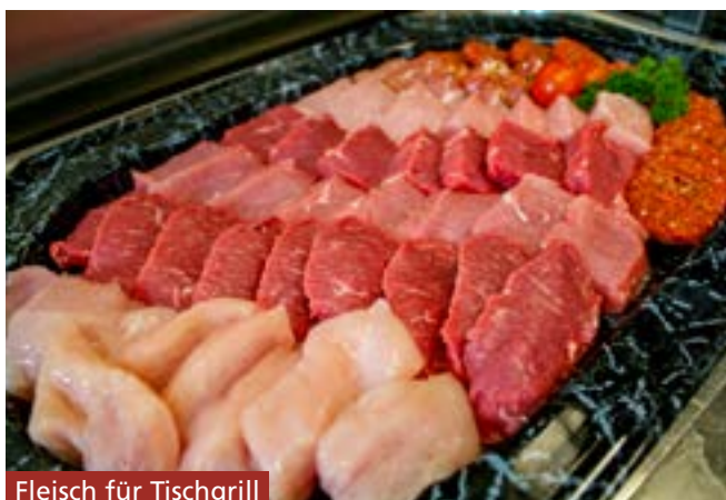
Fleisch für Tischgrill