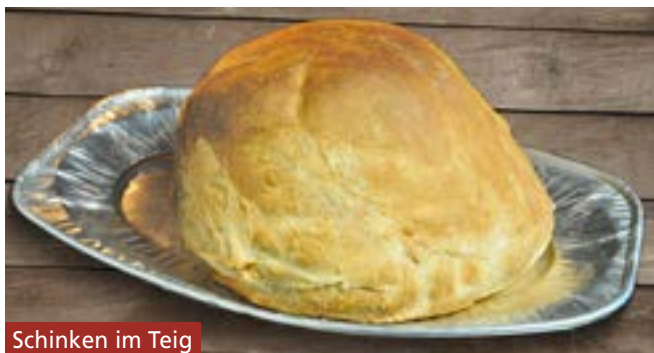
Schinken im Teig