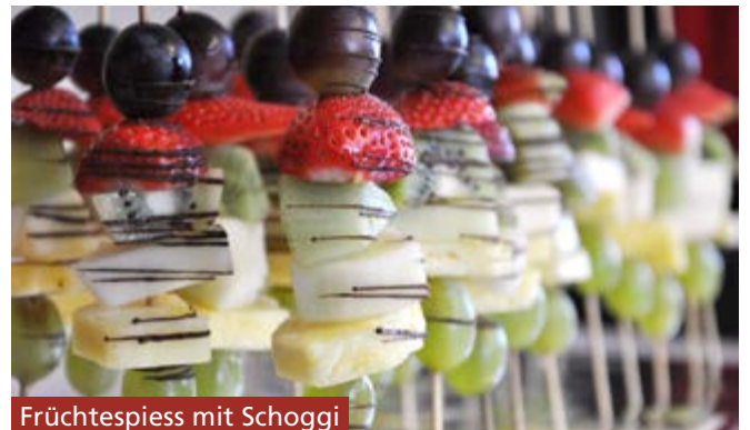
Früchtespiess mit Schoggi