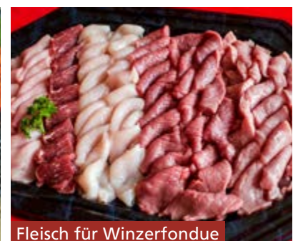
Fleisch für Winzerfondue