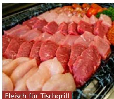
Fleisch für Tischgrill